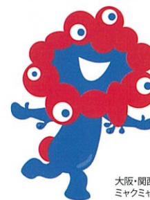
大阪・関西万博公式キャラクター ミヤクミヤク