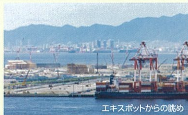
エキスポットからの眺め